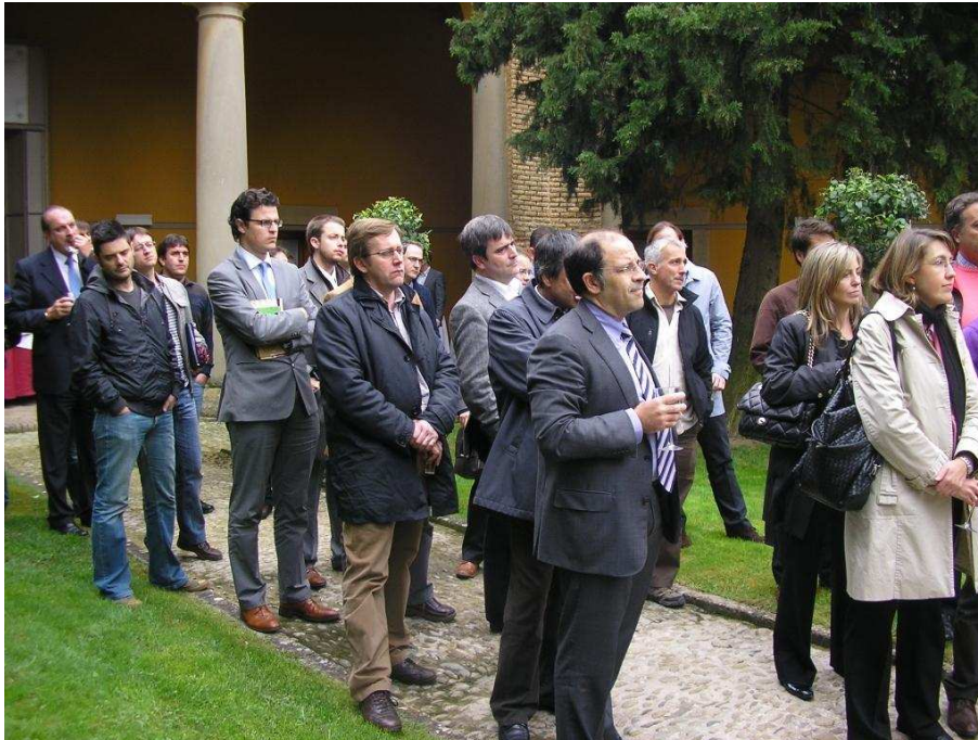
Foto: Participantes en el Congreso, en el Museo Provincial de Huesca