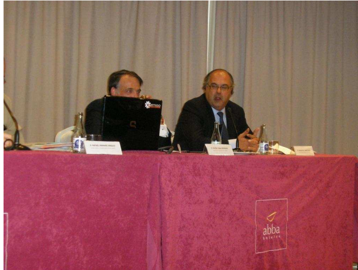
Foto: Javier Tebas y Carlos del Campo

declaradas de utilidad pública, mientras que las Ligas profesionales no pueden serlo.