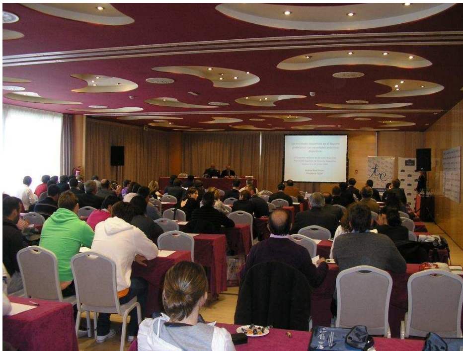
Foto: Salón del Hotel ABBA HUESCA

Finalizó su intervención, comentando que respecto a las SADs del futuro , entiende que se producirán tres situaciones: la incorporación de las minorías y de los aficionados, la disociación entre la gestión económica y la deportiva, y el modelo de responsabilidad reforzada (por el sector).