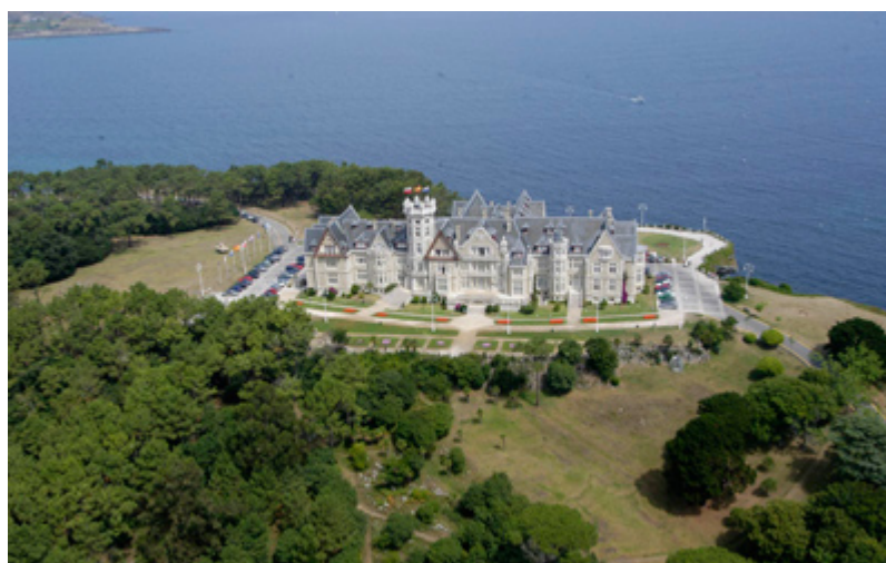
Península de la Magdalena, sede de la UIMP en Santander.