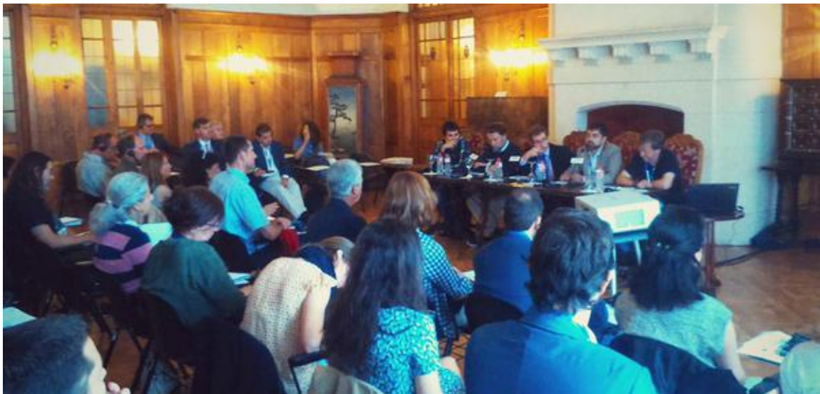
Sesión dedicada al periodismo de investigación en los casos de dopaje.